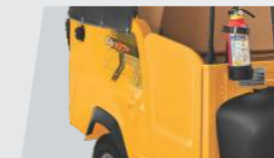
पैसेन्जर सेफ्टी डोर