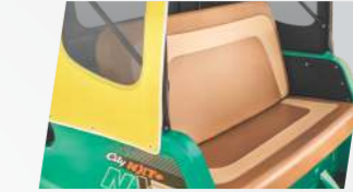
ड्युअल टोन सीट्स