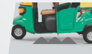
ऊंचा ग्राउंड क्लियरन्स