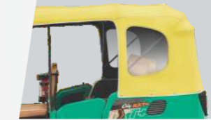
बड़े और पारदर्शी विंडो के साथ स्टाइलिश हुड