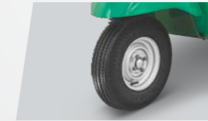
ट्यूबलेस टायर 3 व्हीलर श्रेणी में सबसे पहले