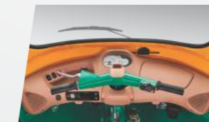
मल्टी इंफॉर्मेटिव डिस्प्ले