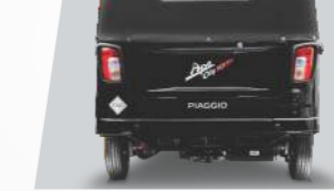
आधुनिक रियर लुक्स