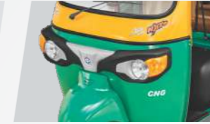
स्टाइलिश फ्रंट फैसिया